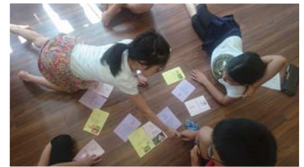
かきくけコモンズの様子

今年の春からかきくけコモンズは親子で一緒に参加して勉強できるようにシフトし、大人もこどもも、それぞれのレベルで「なるほど!」が持ち帰れるセミナーを目指しています。是非一度親子でお金の勉強会にご参加ください。