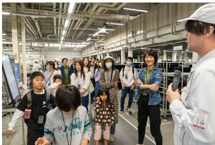
工場内でも丁寧に説明してくれます

さて、休憩をはさんで、ここからは工場見学です。大口工場の敷地面積は何とバンテリンドーム（ナゴヤドーム）約1.4個分だそうです！