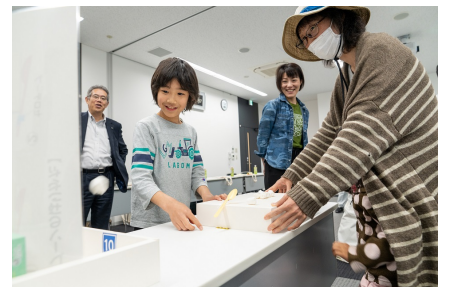
カイゼンして再挑戦！

みんなが考えたカイゼンでもう一度ゲームスタートです。皆、 カイゼンした方が点数が上がりました！ 大喜びです！