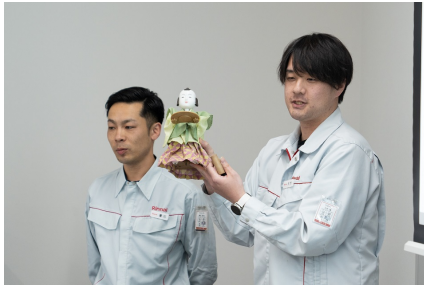
からくり人形の説明

まずはからくり人形でからくりの解説です。からくり人形は 電気も電池もないのに動いています 。みんなから「ほんとに電池がついてるんでしょ？」といった疑問の声がでましたが、人形の服を脱がすと本当に電気も電池もついていません。