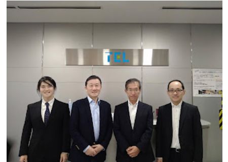
工場玄関での集合写真

工場見学は、説明会ののちトレーニングセンターを見て回り、最後に質疑応答という運びでした。少し驚いたのは、同じ時間に見学していたのがほとんど外国(特に中国・台湾系)の投資家だったことで、見学予定時間を1時間超過するほどの熱の入りようでした。台湾の投資家向け説明会では100名を超える参加があったとのこと、さすがの関心の高さです。