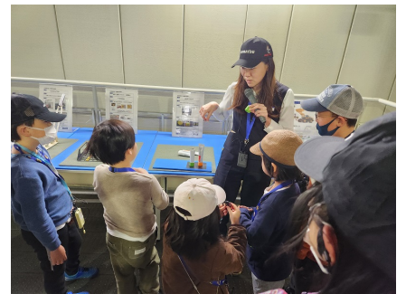
「からくり改善」を体験しました

また、作業がなるべく効率よく、行動に負荷がかからないようにするための「改善」の工夫も随所に行われているようで、「からくり改善」の取組についても具体的に体験させていただきました。