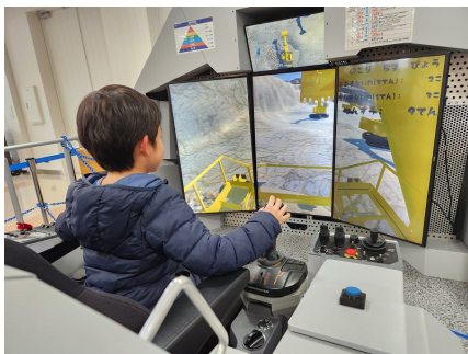
油圧ショベル「PC4000」のシミュレーターゲームを体験