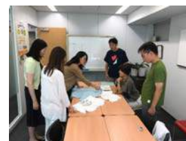
コモンズオリジナルTシャツ作り

お申し込みはこちらから→ https://www.common30.jp/seminars/detail/694