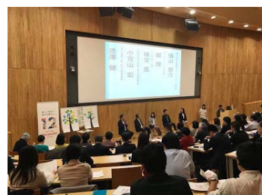
12/1に開催された寄付月間シンポジウムの様子