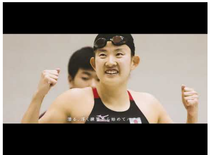
みんなの水泳の絵2020

また第7期運用報告書に2団体よりご挨拶文をいただきました。以下、抜粋したものをご紹介します。ぜひ運用報告書にて全文をご覧ください。