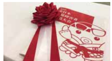
POINT担当 馬越 裕子